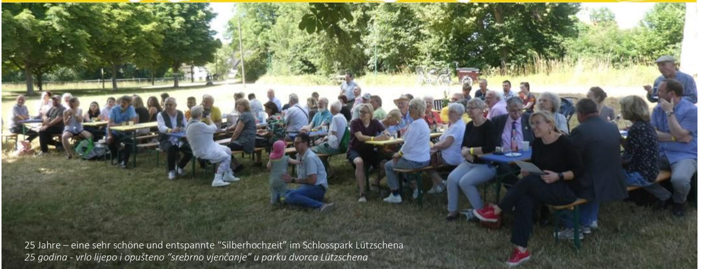
25 Jahre – eine sehr schöne und entspannte “Silberhochzeit” im Schlosspark Lützschena 25 godina - vrlo lijepo i opuštено “srebrno vjenčanje” u parku dvorca Lützschena

Liebe Mitglieder, liebe Freundinnen und Freunde der Städtepartnerschaft in Leipzig und Travnik, Poštovani članovi, dragi prijatelji bratimljenja Lajpciga i Travnika,